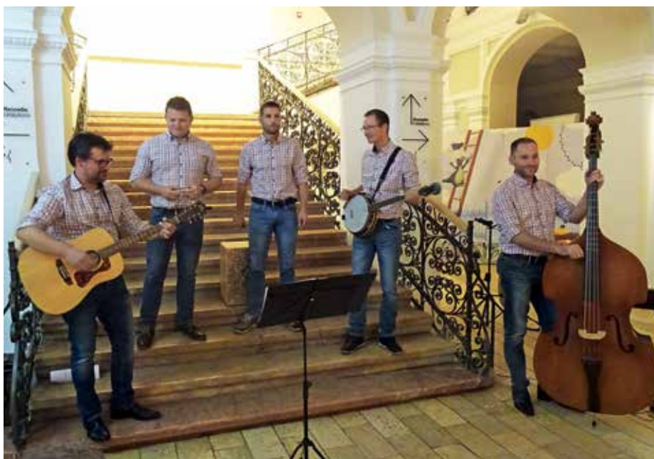
Štedientje v Novem Sadu, v avli Muzeja Vojvodine

Po dopoldanskem ogledu starega mestnega jedra Subotice smo se tako v soboto v deževnem vremenu odpeljali v Novi Sad, kjer nas je ob 19. uri čakal nastop v avli Muzeja Vojvodine v centru mesta. Tudi tu smo peli v čudovitem ambientu in odlični akustiki, tako da so lahko uživali tako pevci kot tudi poslušalci. V uvodu so nekaj pesmi zapeli pevci DS Kredarica, nato je nastopila MVS Pozdrav, piko na i pa so dodali še Štedientje s svojimi izvirnimi skladbami in dovršenim nastopom. Na koncu pa je zazvenela še skupna pesem Triglav moj dom. Med zadovoljno publiko je bilo tudi nekaj Hotaveljcev, ki so se ravno ta dan mudili v Novem Sadu in so nas tudi glasno spodbujali. Po koncertu in večerji pa smo se odpravili v društvene prostore DS Kredarica in tam ob dobri kapljici klepetali in prepevali še dolgo v noč. Nedeljsko dopoldne smo izkoristili za ogled mestnega jedra in nato gostovanje zaključili na Petrovaradinski trdnjavi. Poslovili smo se od gostiteljev s skupno željo, da se še kdaj srečamo.