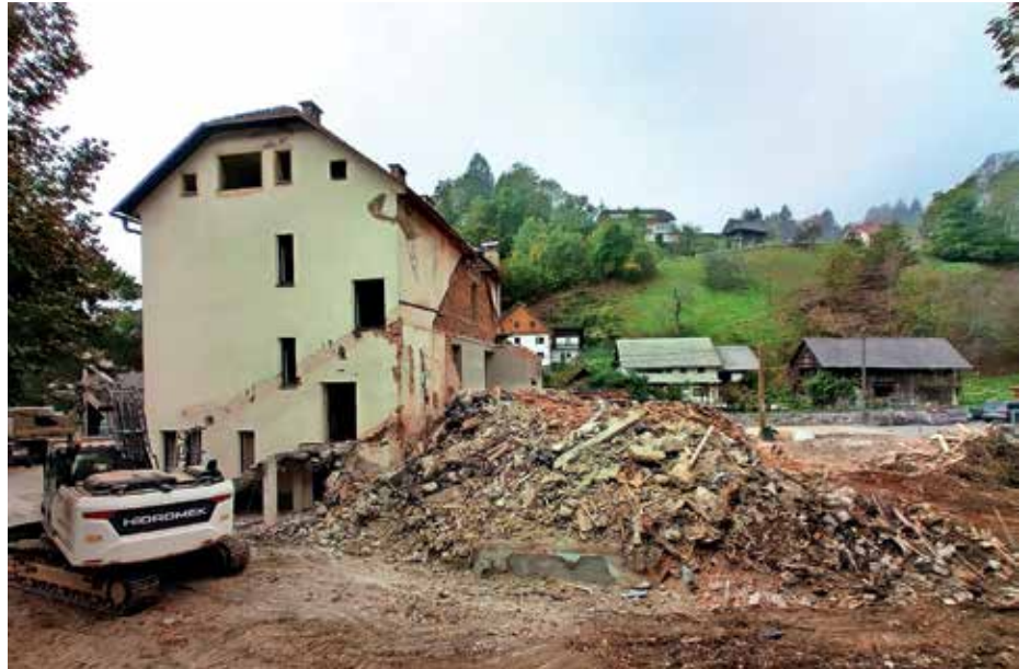
Rušenje starega kulturnega doma se je že začelo.