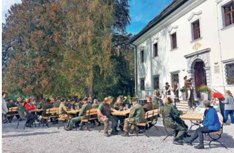
Lovska gostija na Visokem

petek, sobota, nedelja, prazniki: zaprto