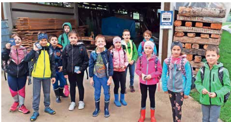
Postaja projekta Pešbus

Če želite o dogajanju na Osnovni šoli Ivana Tavčarja izvedeti več, vas vabimo, da obiščete njeno spletno stran http://www.os-ivantavcar.si .