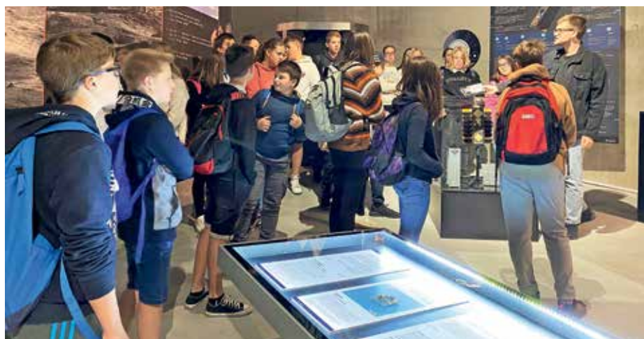
Osmošolci v Centru Noordung

Dvajsetega septembra so učenci od 6. do 9. razreda imeli ekskurzije po Sloveniji. Šesti razred je raziskoval Notranjsko – Postojnsko jamo, Predjamski grad in Cerkljiško jezero. Sedmošolci so si ogledali Dolenjsko, in sicer Muljavo, Rašico, Krško