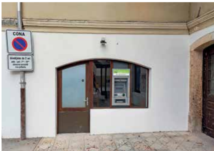
Bankomat v Poljanah so prestavili na naslov Poljane nad Škofjo Loko 28.

pri čemer začasni sprejem traja po dogovoru oziroma največ devetdeset dni. »Enota za dnevno varstvo bo v pritličju, kjer je tudi velik večnamenski prostor, ki se odpira na deloma pokrito teraso. V zgornjih dveh nadstropjih pa je še osem dvoposteljnih sob, do katerih bodo uporabniki lahko dostopali tudi z dvigalom,« je pojasnil Strel in dodal, da so v pritličju uredili še manjšo razdelilno kuhinjo, sicer pa bodo prehrano zagotavljali iz CSS Škofja Loka.