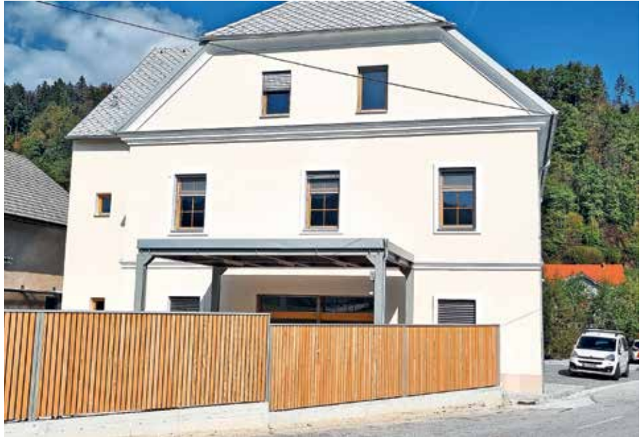
Upravna enota Škofja Loka je konec septembra izdala uporabno dovoljenje za Hišo generacij.

tudi razpise za zdravstveno-negovalni kader in za zaposlitve v kuhinji. Predvidoma bo v Hiši generacij, kjer bodo vzpostavili enoto dnevnega varstva in omogočili začasno namestitev za starejše, zaposlitev našlo deset oseb. V