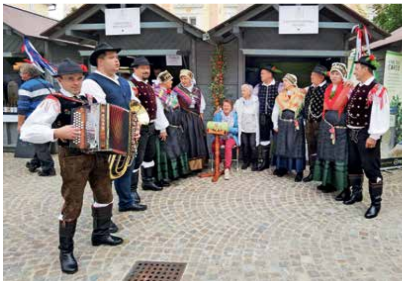
Na sejmu v Celovcu

Zanimivosti in zgodbe Poljanske doline pa smo imeli priložnost predstaviti tudi v oddaji Napotki na prvem programu Radia Slovenija. V deveti sezoni oddaj, v kateri so rdeča nit doline, je bila prva prav o Poljanski dolini.