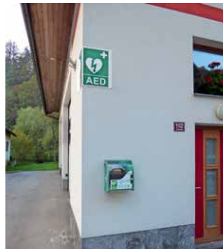
Defibrilator na hotaveljskem gasilskem domu je nameščen na dobro vidnem mestu.

rem bodo strokovno prikazali uporabo defibrilatorja in postopke oživljanja ob zastoju srca. Prikaz je namenjen vsem občanom, saj kot dodaja Potočnik, tehnika sama po sebi nič ne koristi, če je ne znamo uporabljati. Pomembno je, da čim več ljudi zna ravnati s temi napravami, saj je tako možnost za hitro pomoč in preživetje ljudi, ki doživijo srčni zastoj, večja. Po njegovih besedah je uporaba defibrilatorja enostavna, namenjena je laičnim osebam, v veliko pomoč so zvočna navodila, s pomočjo katerih je možno izpeljati oživljanje, zato je bojazen, da bi karkoli šlo narobe, odveč. Za uspešno ukrepanje je ključnih prvih pet minut po zastoju srca, pomembno je tudi kombiniranje temeljnih postopkov oživljanja in uporabe defibrilatorja.