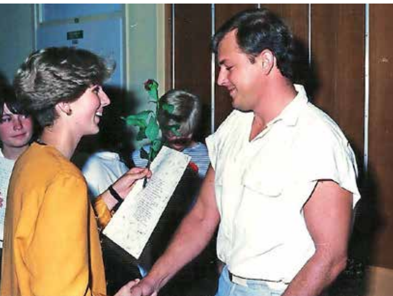
Na valeti, junij 1988

Poklic sem od začetka do zadnje ure opravljal z vso resnostjo, tako da niti nisem razmišljal v tej smeri, kaj je bilo najtežje in kaj manj. Seveda se je nabralo v teh 40 letih nekaj stvari, ki so odstopale od povprečja. Toda vedno je bilo treba poiskati najboljšo pot do cilja. Trudil sem se priti do cilja brez konfliktov z učenci, starši, sodelavci, vodstvom. Da je moja pedagoška kariera pustila takšen ali drugačen pečat na učencih, je razvidno med drugim iz komentarjev pod mojo objavo na Facebooku o zadnjem delovnem dnevu. Odzvali so se učenci starejših generacij in tudi sodelavci. Zelo sem vesel, da komentarjev z nega-