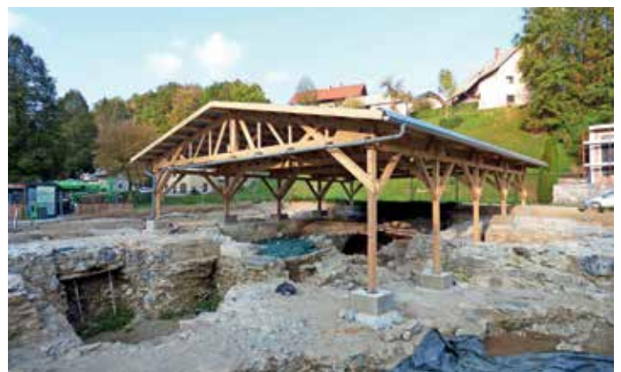
Arheološko najdišče v središču Poljan so zaščitili z začasno nadstrešnico.