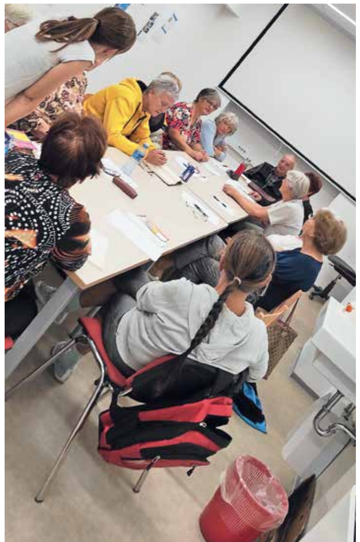
Delavnica za odrasle: Aerobika možganov

Z novembrom najjavljamo začetek osme sezone Družinskega branja. Mlade bralce vabimo, da se nam pridružijo v branju novega nabora pravljic in si ponovno z branjem priborijo lepo nagrado, ki naj zaenkrat ostane presenečenje. Knjižnice z vprašanji že čakajo na vas. Sredi septembra smo v knjižnici zaključili likovni natečaj na temo Škofjeloške pravljice in pripovedke. Otroci so z ilustracijami predstavili razmišljanja, fantazije, čustva in opažanja ob poslušanju pripovedk. Na natečaj je prispelo 76 likovnih del in med njimi smo izbrali najboljše in jih