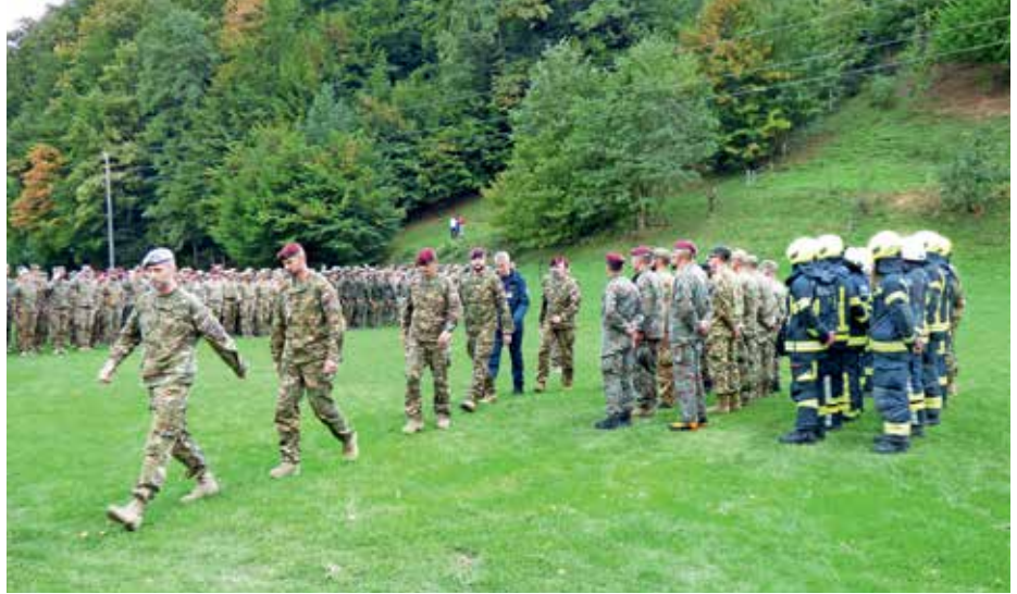
Vaja se je zaključila s prireditvijo na Hotavljah.

Kot redni gostje so se enotam 132. gorskega polka in drugim enotam slovenske vojske na usposabljanju iz vojaškega gorništvaja in bojevanja na zahtevnem terenu že tradicionalno pridružile enote oboroženih sil Velike Britanije in ZDA. Poleg njih so letos sodelovale tudi enote oboroženih sil Poljske in Madžarske. Prvi in drugi del vaje so izvedli na vojaških vadiščih v okolici vojašnice na Bohinjski Beli. Prvi del je bil namenjen izvedbi individualnih veščin pripadnikov: pravilna uporaba