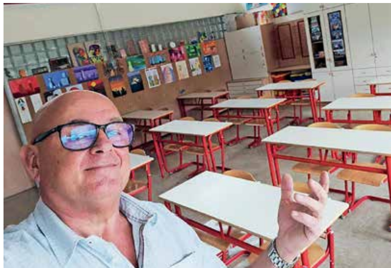
Zadnji delovni dan v učilnici, 26. 9. 2022

Tako je. V tem obdobju sem učil likovno vzgojo, ki se je pozneje preimenovala v likovno umetnost, izbirni predmet likovno snovanje in tehniko v 6. razredu. Z učenci sem sodeloval na likovnih natečajih, na katerih smo dosegali lepe rezultate na državnem nivoju (najvišje na temo košarke – plakat in rasizma). Vsako leto smo sodelovali na Mali Groharjevi koloniji v Škofji Loki, kjer smo večkrat prejeli nagrade za najboljše likovne izdelke. Kot razrednik sem prehodil pot z veliko generacijami,