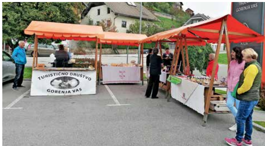
Tržnica v Gorenji vasi

Veseli nas, da smo čez vsa ta leta izvedli več kot 130 zanimivih dogodkov ter uresničili kar nekaj razvojnih ciljev, ne nazadnje ohranili sodelovanje z akterji na podeželju, s katerimi smo tudi letos pripravili zanimive in raznolike vsebine. Namen Tedna podeželja je povezovanje društev in institucij na našem območju, sodelovanje z ministrstvom za kmetijstvo, predstavitev ponudnikov in društev na podeželju, izvedba aktualnih izobraževanj, predstavitev rezultatov izvedenih razvojnih aktivnosti in načrtovanje novih. V sodelovanju s partnerji – LAS loškega pogorja, KGZS – Zavod Kranj, enota za kmetijsko svetovanje Škofja Loka, Zavod Poljanska dolina, Javni zavod Ratitovec, Društvo za Razvoj podeželja Resje, Čebelarstvo društvo Škofja Loka, Turistično društvo Žiri in Turistično društvo Gorenja vas – in ob podpori vseh štirih občin na Škofjeloškem smo pripravili vsebinsko obogatene tržnice v Škofji Loki, Gorenji vasi in Žireh, izobraževanje o uporabi družabnih omrežij za promocijo in trženje, delavnico LAS loškega pogorja z društvi in nevladnimi organizacijami o možnostih sofinanciranja aktivnosti in investicij