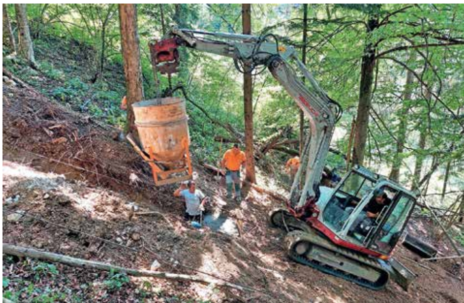
Vkop vodovoda v strmem delu nad Dolino miru v smeri proti Dolгим Njivam

Zaradi gradnje se na terenu srečujejo z nekaterimi težavami, in sicer pri vzpostavljanju zemljišč v prvotno stanje, del