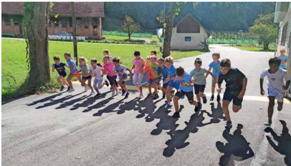
Množični tek otrok

Sedemnajsti september – dan zlatih knjig vsako leto velja za začetek branja za bralno značko, zato je bil ponedeljek, 19. september, pravi dan, da so učenci začeli skupno branje z bralnimi minutkami. Vsak dan v tem tednu so prvih deset