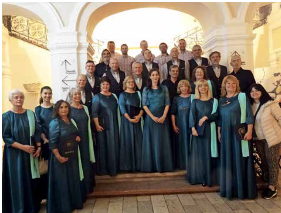
MVS Pozdrav z gostitelji DS Kredarica v Novem Sadu

Povabilo za gostovanje v Subotici in Novem Sadu smo dobili že v pripravah na organizacijo koncerta Rojaki pojejo, ki smo ga Pozdravovci uspešno organizirali julija letos pred dvorcem Visoko. Na tem koncertu so nastopile tri pevske skupine, ki delujejo v Društvu Slovencev Kredarica v Novem Sadu, in sicer Ženska vokalna skupina Verse, Moška vokalna skupina Fantje in Mešani pevski zbor Kredarica. V uvodu pa jih je z venčkom gorenjskih plesov pozdravila Folklorna skupina Zala iz Turističnega društva Žirovski Vrh. Sodelovanje med pevci MVS Pozdrav in pevci DS Kredarica traja že od leta 2015, ko so Novosadčani prvič gostovali v Gorenji vasi. Pozdrav jim je nato obisk vrnil naslednje leto. Letos, ko so prišli v Poljansko dolino z vsemi tremi pevske skupine, pa so tudi nam dali možnost, da s seboj pripeljemo še kakšno pevsko skupino. Odločili smo se za domačo Vokalno-instrumentalno skupino Štedientje. Poleg tega pa so nam dali možnost nastopa še v Subotici, kjer tamkajšnje Društvo Slovencev Triglav vsako leto organizira srečanje pevske skupine, ki delujejo v društvih Slovencev v Srbiji. Tako smo v petek, 30. septembra, peli v čudoviti in akustični dvorani subotičke Gradске kuče, ki je ponos Subotice. Poleg nas